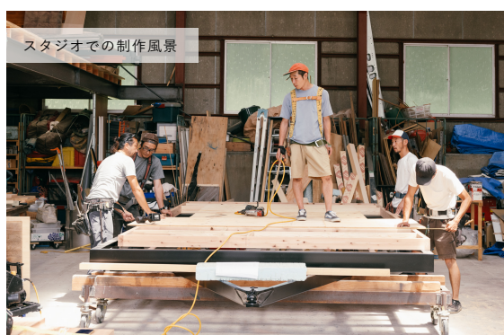
スタジオでの制作風景