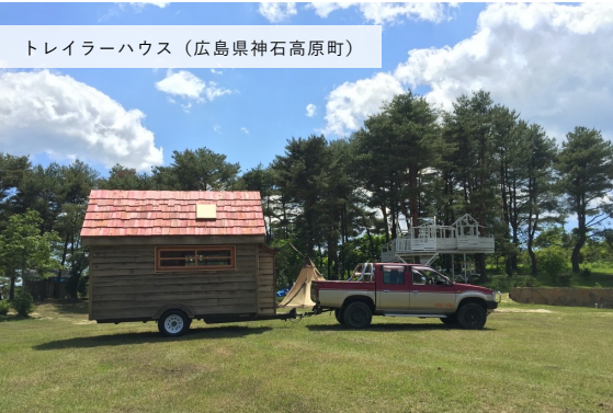
トレーラーハウス (広島県神石高原町)