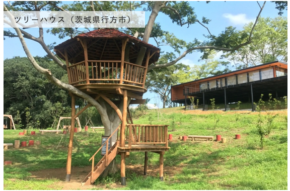
ツリーハウス (茨城県行方市)