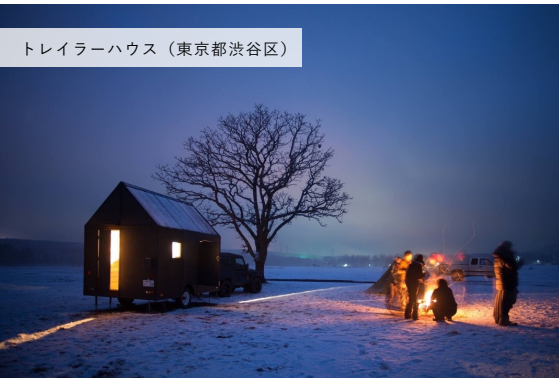
トレーラーハウス (東京都渋谷区)