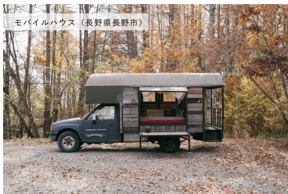
モバイルハウス（長野県長野市）