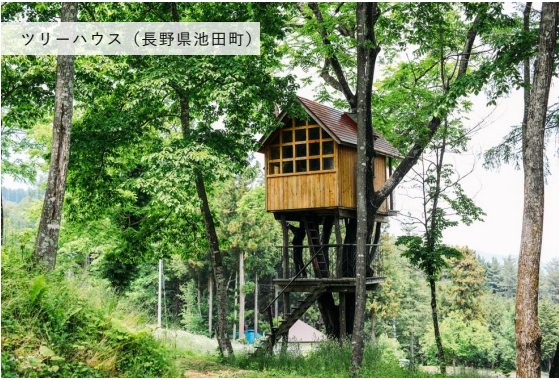
ツリーハウス (長野県池田町)