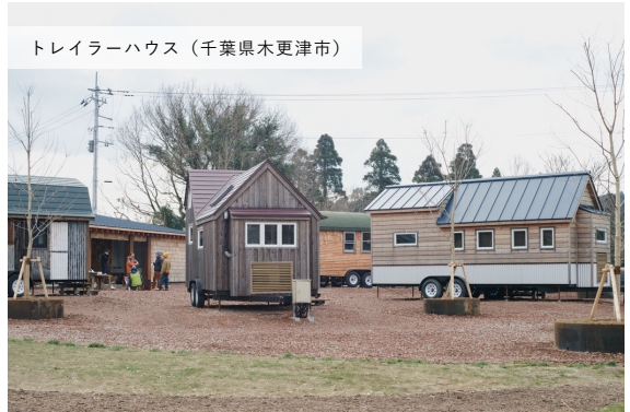
トレーラーハウス (千葉県木更津市)