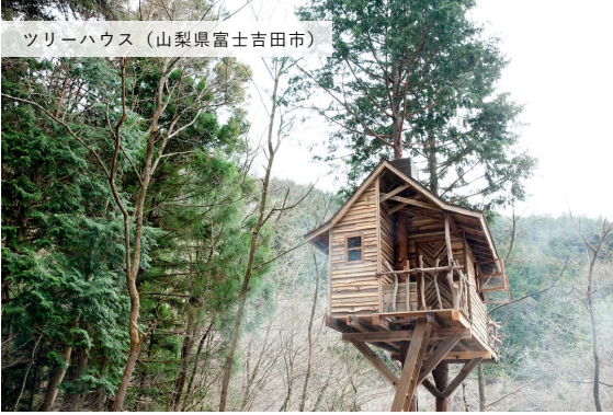
ツリーハウス (山梨県富士吉田市)