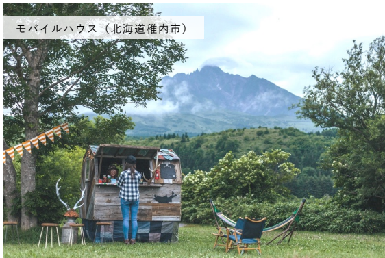
モバイルハウス（北海道稚内市）