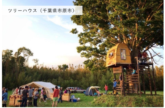
ツリーハウス (千葉県市原市)