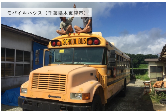
モバイルハウス（千葉県木更津市）