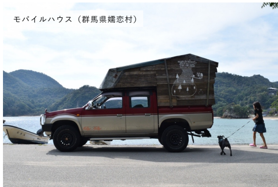
モバイルハウス（群馬県嬭恋村）